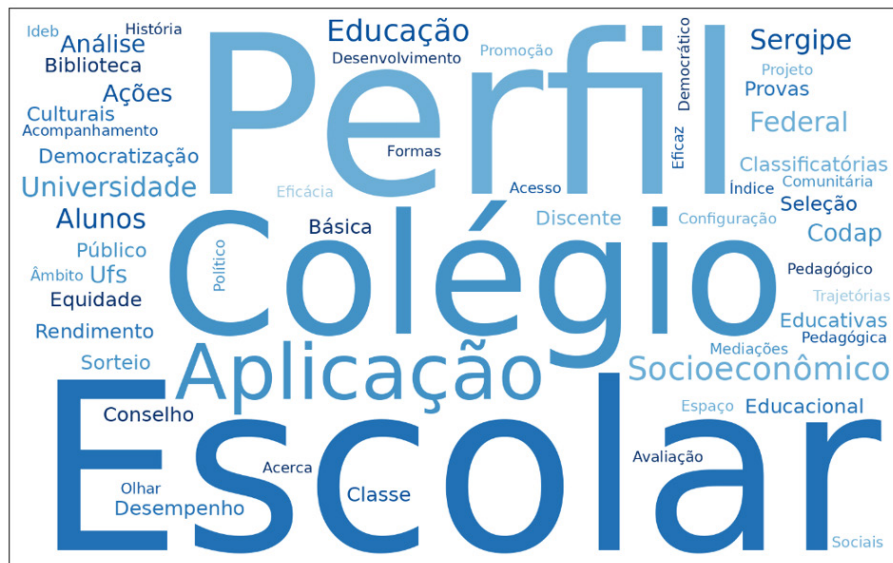
Figura 1 – Nuvem de palavras com base nos títulos e nas palavras-chave dos capítulos.

Elaboração: Robson Andrade de Jesus, com o auxílio do Google Colab (2026).